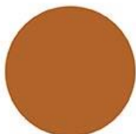
Св. коричневый 3514